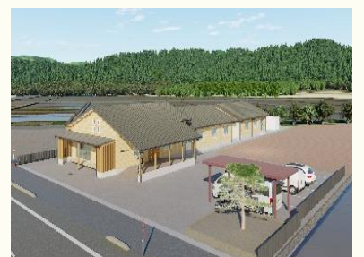
完成イメージ図です！