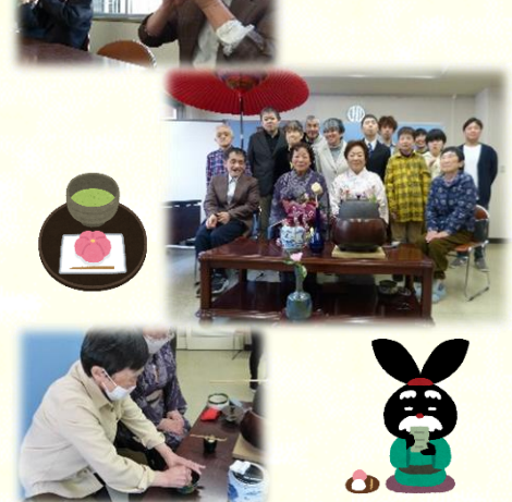
茶道教室の先生の教えに習い、皆さんにおもてなしの作法を披露し、お茶会の雰囲気を楽しみました！