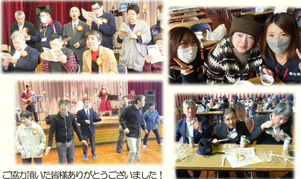
ご協力頂いた皆様ありがとうございました！