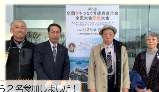
家族会から2名、新生苑から2名参加しました!

また防災においては、災害はあると意識をして備えることが必要であり、地域とのつながりがいろいろなことでも大事と学ぶことができました。