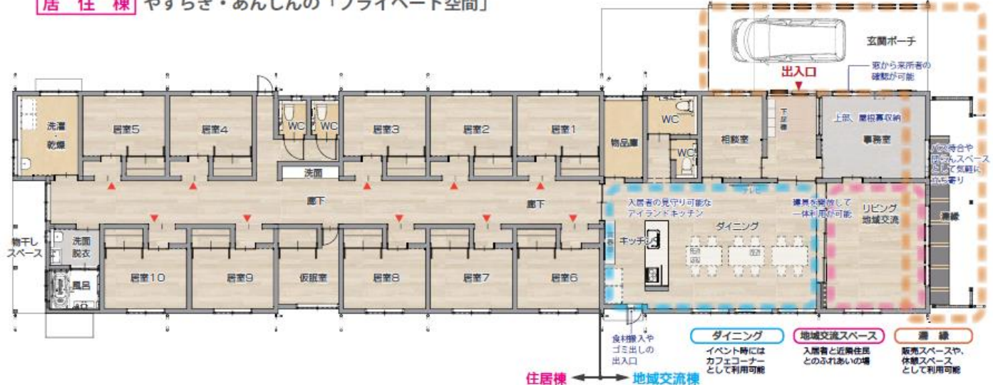
バス停・くつろぎスペース