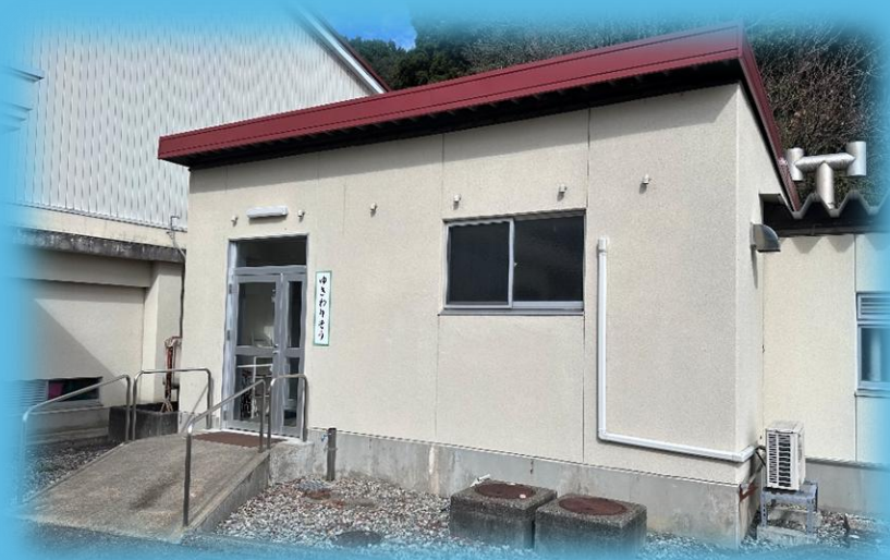
ゆきわりそう 前景